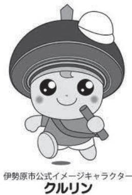
伊勢原市公式イメージキャラクター クルリン

会も将来を見て様々な課題を自覚し、行政と連携しながら、高齢者、障がいをもつ私たちの生活、年金、医療、介護などの財源を安定した生活を市に託す形になります。多くの人達が、「伊勢原に住み良かった!」と感じる街にしたいと思いますが、今後も前向きな気持ちで活動をして行きたいと思っています。