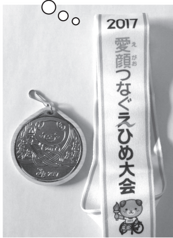
立幅跳 記録 1m61cm (2位) 区分「4」2部 (片下肢)