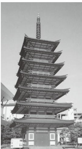
海老名中央公園 観光シンボルモニュメント「七重の塔」