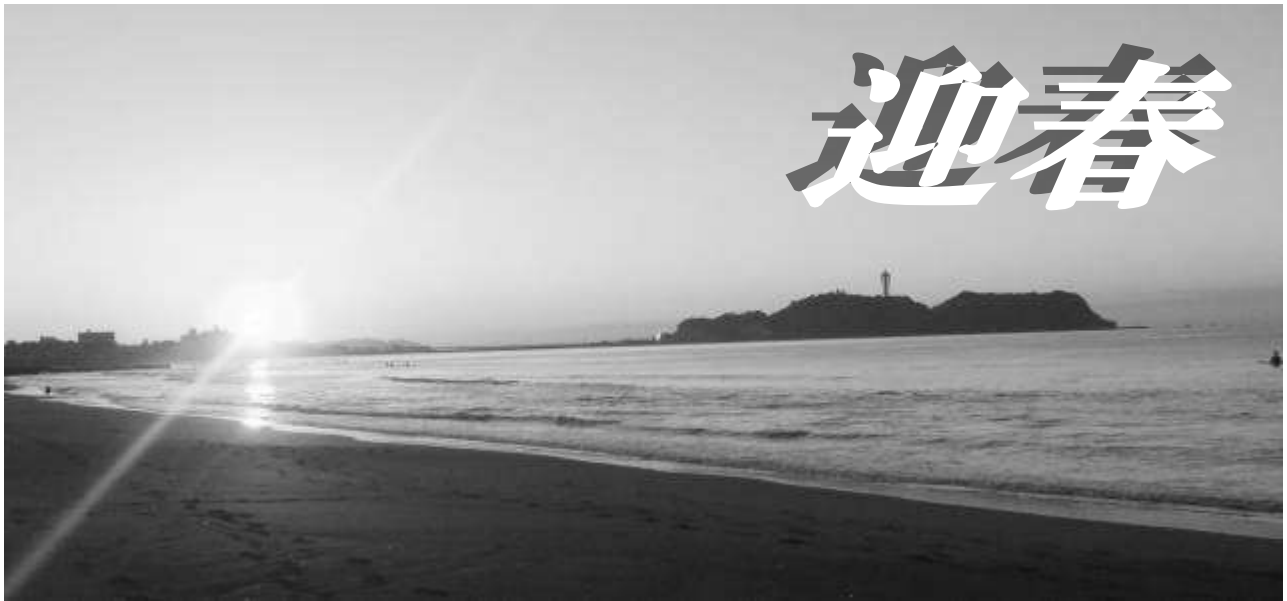
《撮影場所：鶴沼海岸》