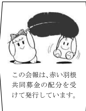
この会報は、赤い羽根共同募金の配分を受けて発行しています。

話す言葉数に対して書ける文字数は二〇%程です。そのため、重要な事柄、伝えなければならぬ事柄を要約して書いていく方法です。