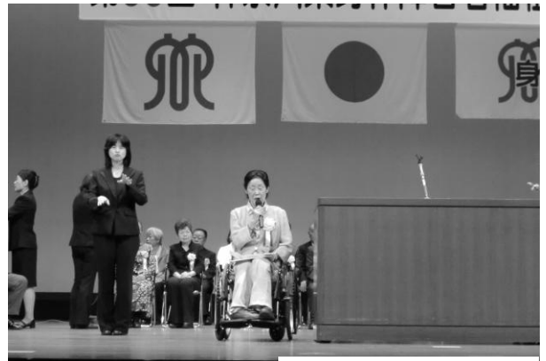
〈戸井田会長あいさつ〉