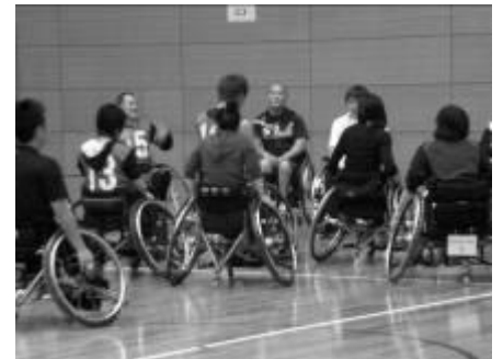
《車椅子バスケットボール》