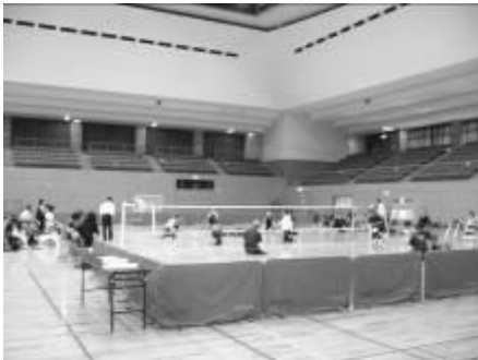
《ローリングバレーボール》