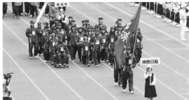
《神奈川県選手団入場行進》