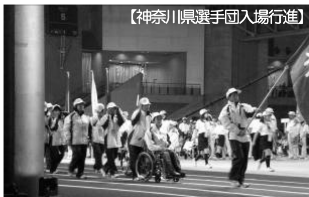
〔神奈川県選手団入場行進〕