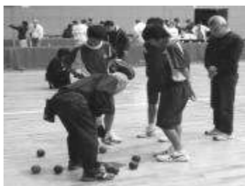
《 ボッチャ 》