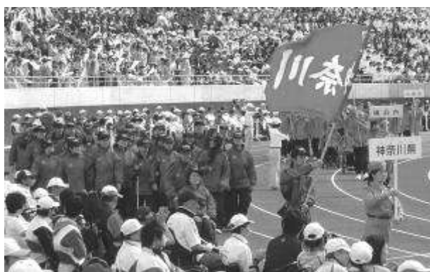
【神奈川県選手団入場行進】