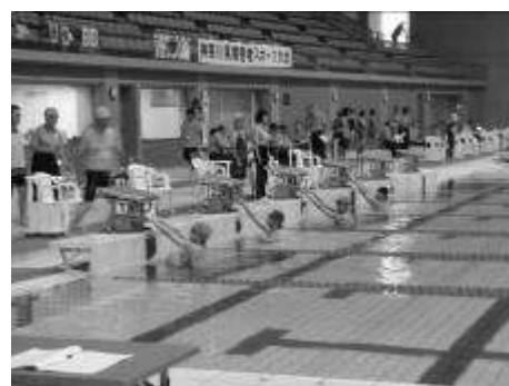
【平成23年度 水泳競技会】