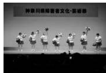
【ダンスサークル フラッシュ】