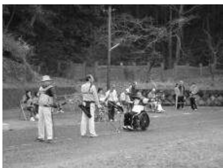
【平成23年度 アーチェリー競技会】