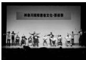
【アガペセンター&座間悠舞】