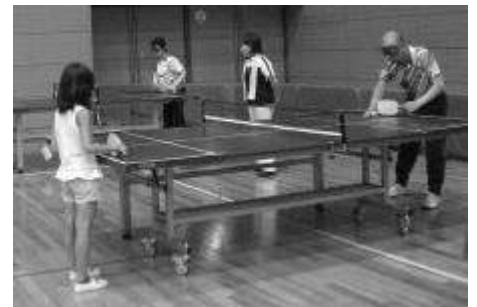
【サウンドテーブルテニス】