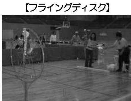
【フライングディスク】