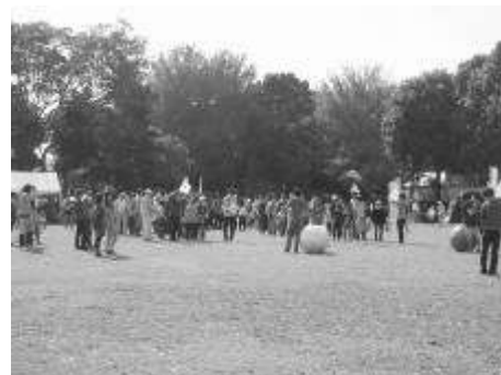
【催し物：ミニ運動会】

回 答 183名(正解者120名、不正解者63名) 回答者 ・80代 13名(女8名、男5名) ・70代 37名(女21名、男16名) ・60代 38名(女21名、男17名) ・50代 16名(女10名、男6名) ・40代 22名(女17名、男5名) ・30代 20名(女13名、男7名) ・20代 7名(女6名、男1名) ・20才未満 9名(女6名、男3名) ・未記入 21名