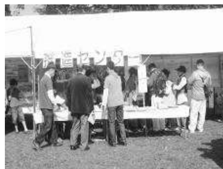
【推進センターコーナー様子】